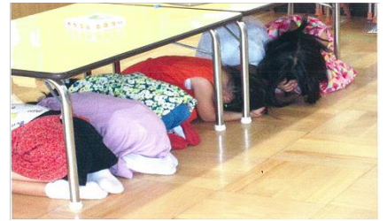
↑安城市立えのきこども園でのシェイクアウトの様子(2021年)